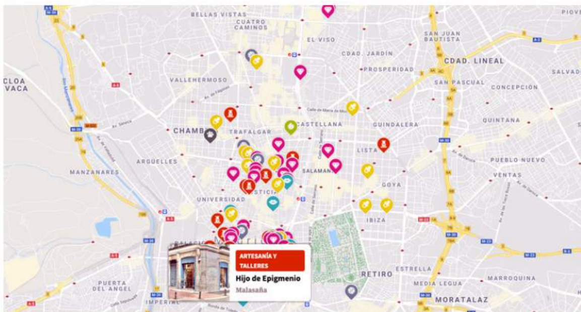
Seleccionas categoría, pulsas 'Buscar' y los comercios más curiosos de Madrid se despliegan ante ti

“Queríamos darle un toque humano y recopilar estas historias. A las dos nos encanta leer y es fascinante las historias que encierran, el esfuerzo que hay detrás, las vidas (porque la gente da giros de 180 grados). Nos encanta esa parte”. Y de ahí también el nombre, +QueUnLocal: “te permite conocer la ciudad mejor que un local y además demostrar que ese comercio es más que un local, más que un simple establecimiento”, cuentan.