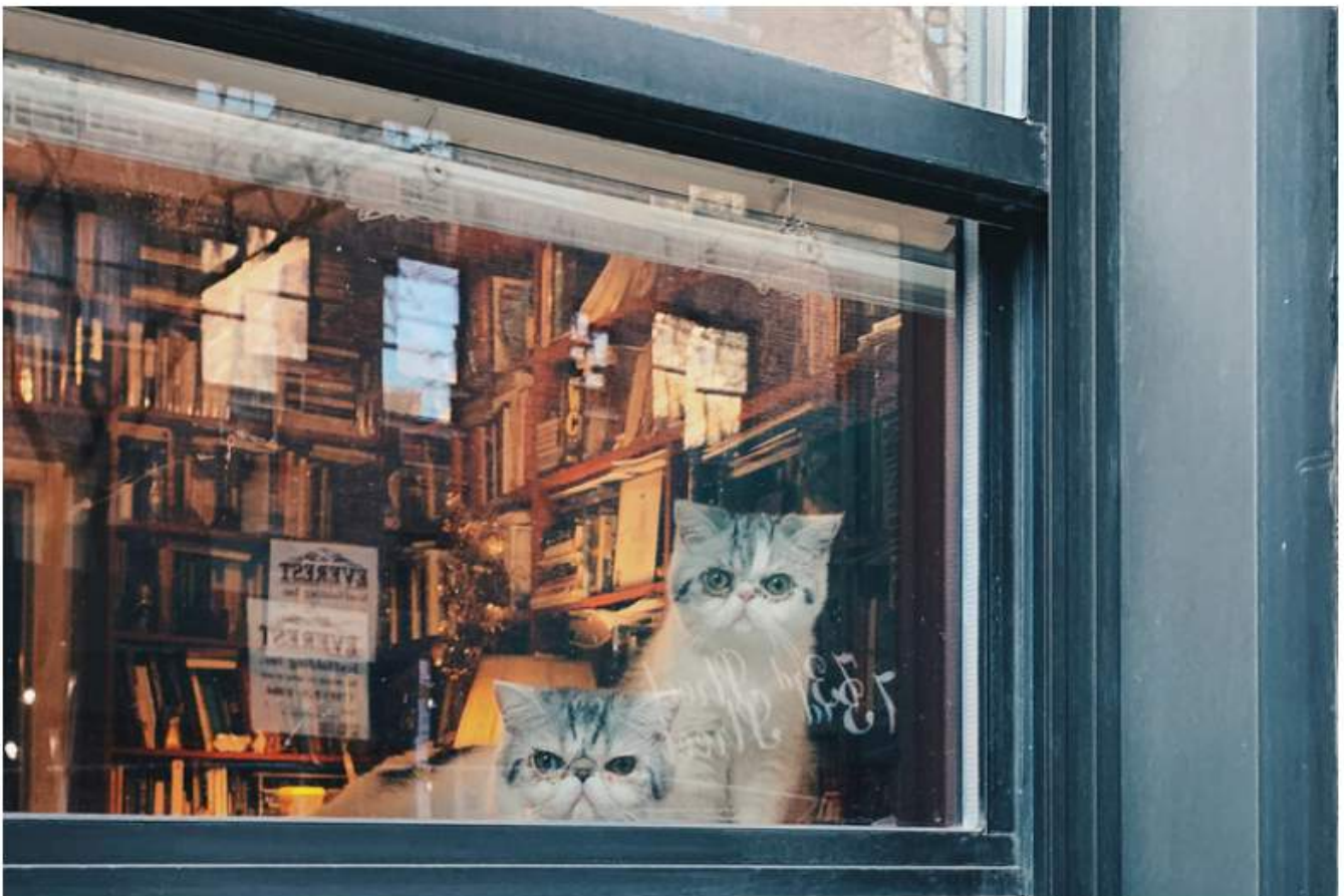
Librerías, joyerías, tiendas de decoración, de artesanía, de muebles...